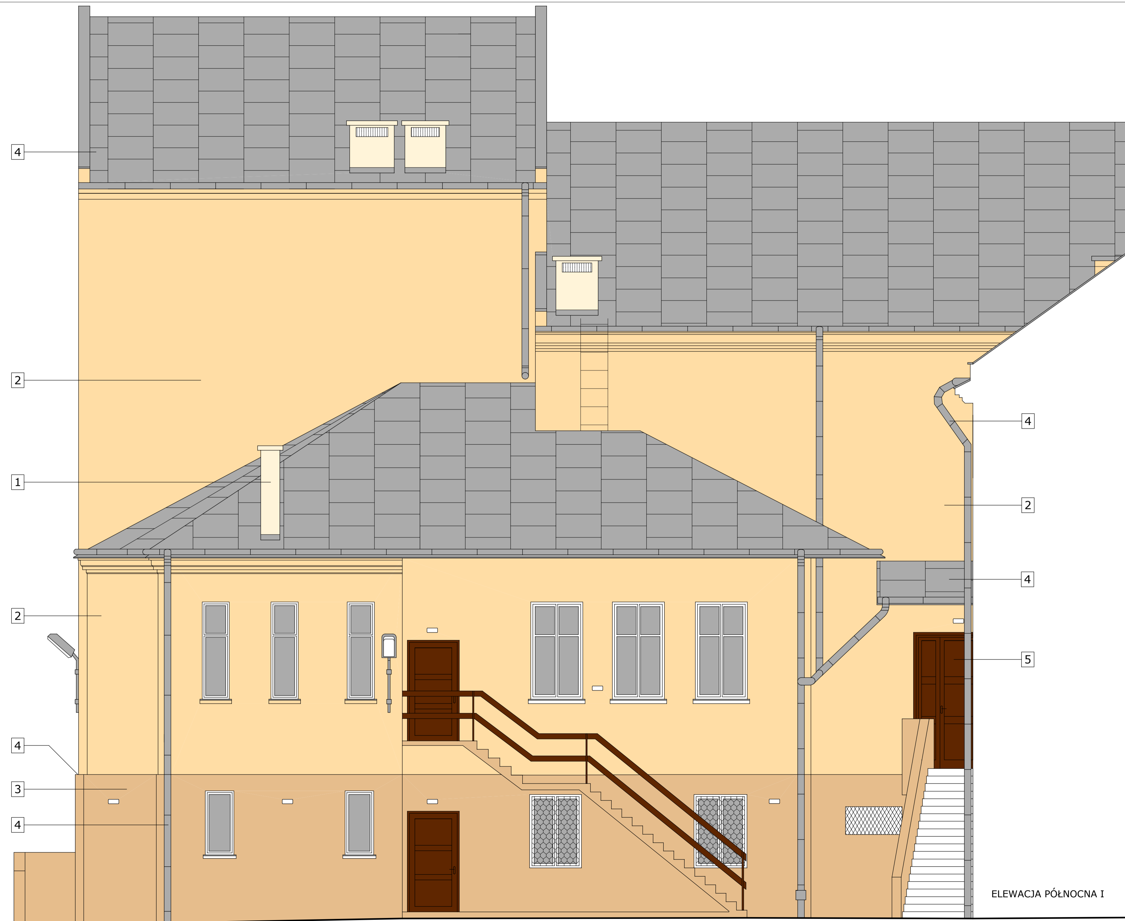
ELEWACJA PÓŁNOCNA I